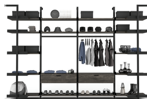
G9 SECTION: 30" + 36" + 36" + 30" L/W 141 1/2" X L/D 33" X H 92"

THE DRAWERS AND SHELVING ARE FULLY ADJUSTABLE WITHIN THE ALUMINUM FRAME, AS THE INTERNAL SUPPORT BRACKETS SLIDE FREELY FROM TOP TO BOTTOM. ALL DRAWERS ARE EQUIPPED WITH BOTTOM-MOUNTED BALL BEARING SOFT-CLOSE GLIDES AND SILK HAND-FINISHED INTERIORS. THE ALUMINUM FRAMING IS AVAILABLE IN A NATURAL ANODIZED FINISH AND BLACK ANODIZED FINISH. MULTIPLE STAIN COLOURS ARE AVAILABLE FOR EACH WOOD SPECIES. PLEASE, REFER TO THE PRICE LIST FOR MORE DETAILS.