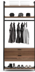
G2 SECTION: 40" L/W 43 1/2" X L/D 21" X H 92"