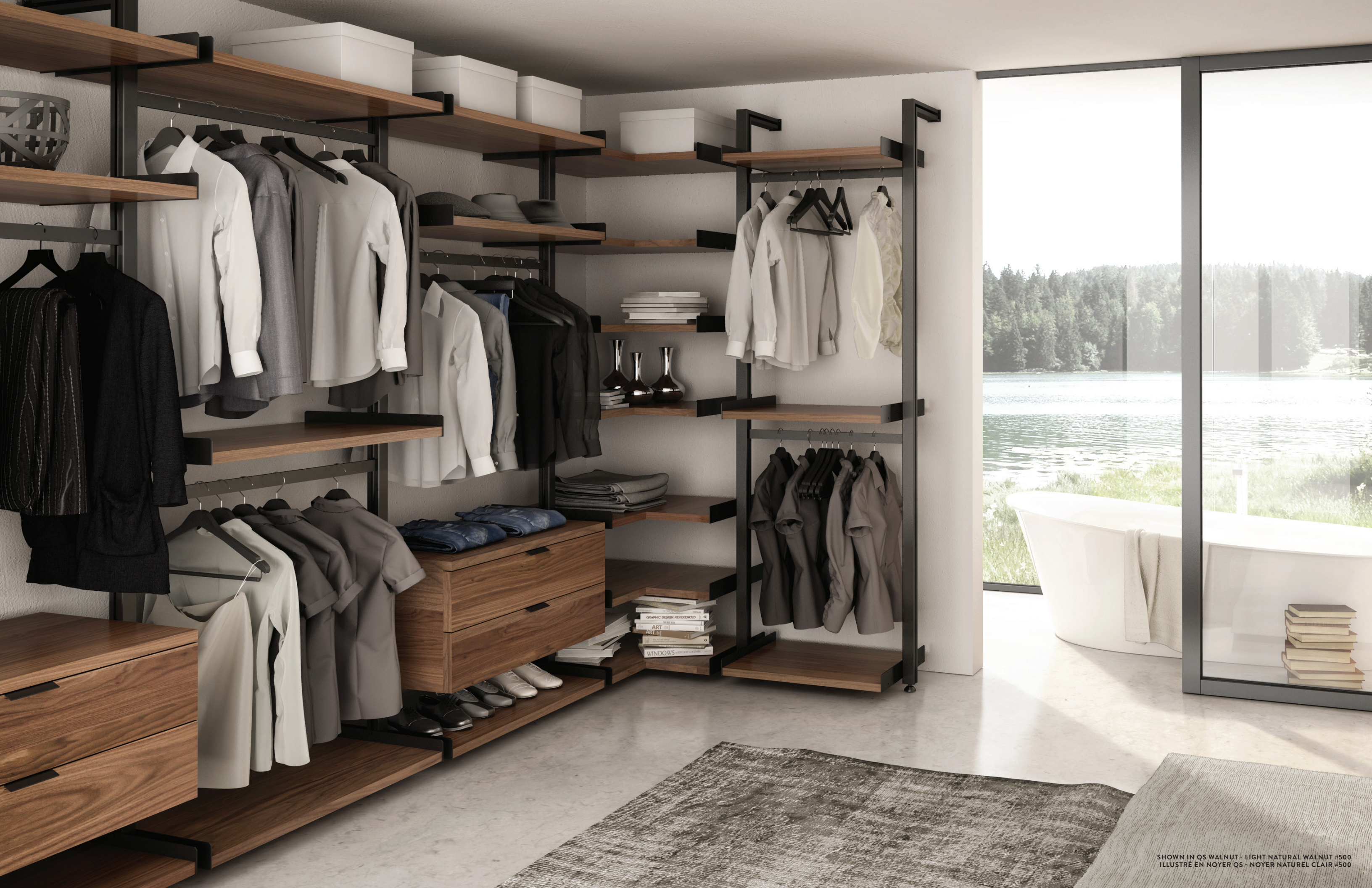
SHOWN IN QS WALNUT - LIGHT NATURAL WALNUT #500 ILLUSTRÉ EN NOYER QS - NOYER NATUREL CLAIR #500