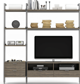
G4 SECTION: 24" + 60" L/W 89 1/4" X L/D 21" X H 92"