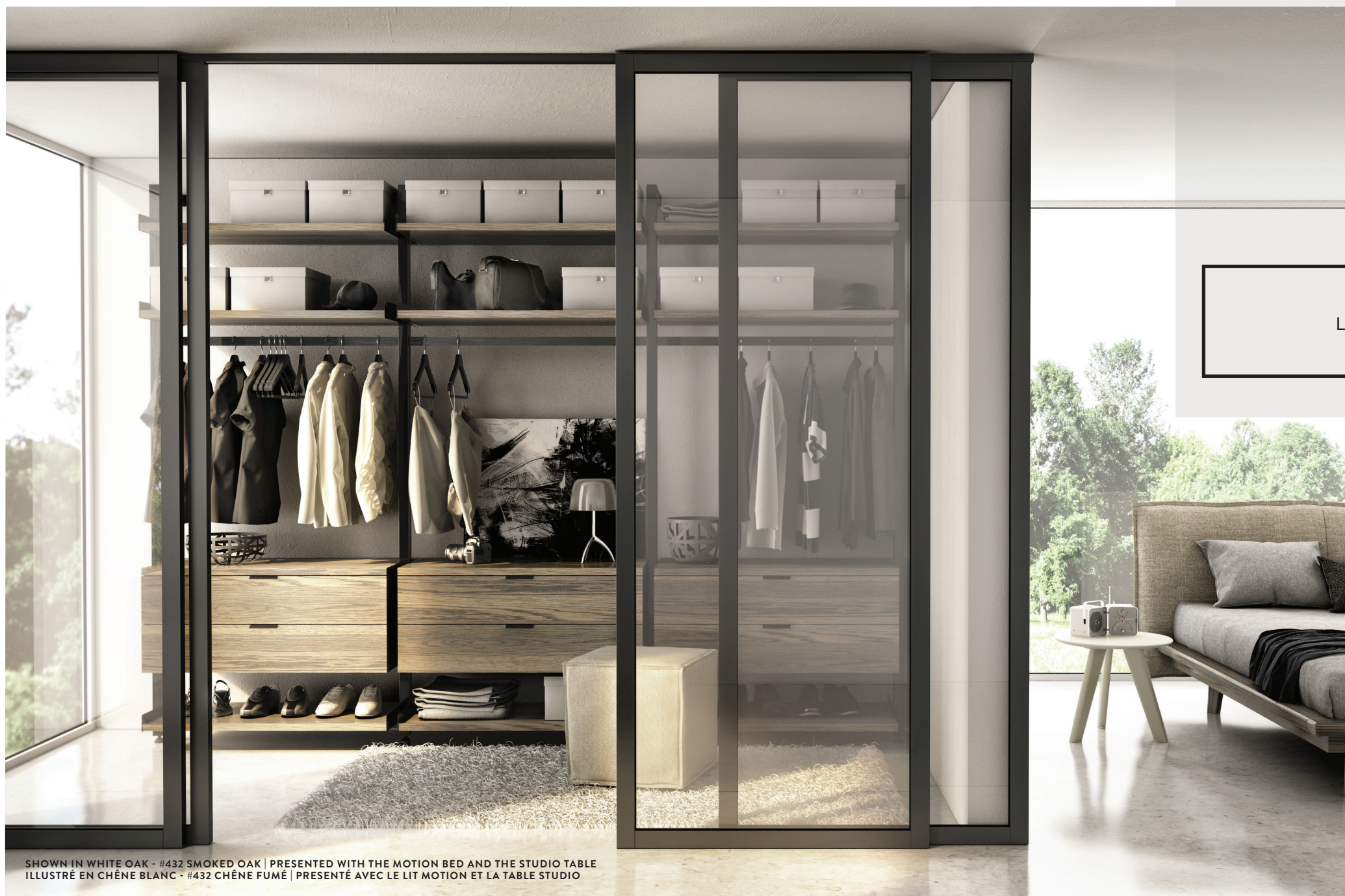
SHOWN IN WHITE OAK - #432 SMOKED OAK | PRESENTED WITH THE MOTION BED AND THE STUDIO TABLE ILLUSTRÉ EN CHÊNE BLANC - #432 CHÊNE FUMÉ | PRÉSENTÉ AVEC LE LIT MOTION ET LA TABLE STUDIO