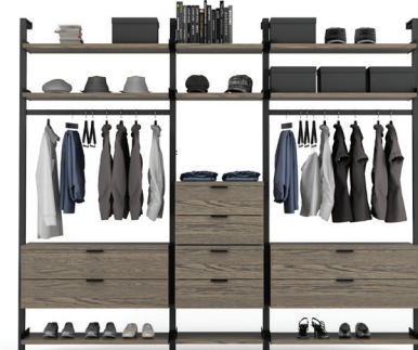
G8 SECTION: 40" + 24" + 40" L/W 111" X L/D 21" X H 92"