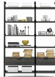
G3 SECTION: 36" + 24" L/W 65 1/4" X L/D 21" X H 92"