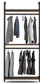
G1 SECTION: 40" L/W 43 1/2" X L/D 21" X H 92"