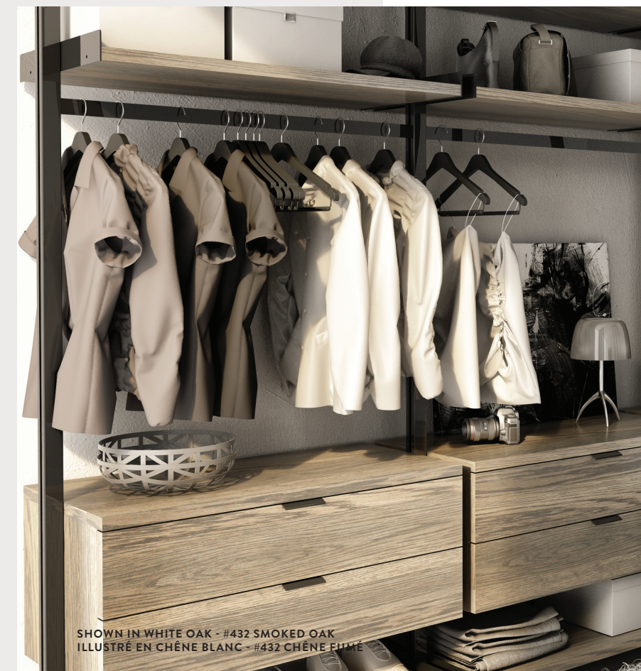
SHOWN IN WHITE OAK - #432 SMOKED OAK ILLUSTRÉ EN CHÊNE BLANC - #432 CHÊNE FUMÉ

LA COLLECTION GRAVITY FAIT PARTIE DE LA GAMME UP PAR HUPPÉ. FABRIQUÉ AVEC DES MATÉRIAUX 100% D'ICI, SES FORMES SONT ÉPURÉES, SES FONCTIONNALITÉS SIMPLES, ET SON STYLE SOPHISTIQUÉ. LE CŒUR DU SYSTÈME GRAVITY EST SON CADRAGE, QUI PEUT ÊTRE CONSTRUIT SUR MESURE COMME STRUCTURE COMPLEXE POUR REMPLIR UN GRAND ESPACE OU SIMPLE POUR SE NICHER DANS UN ENDROIT RESTREINT À L'INTÉRIEUR D'UN LOFT. LE CADRAGE EXTERNE EST FAIT D'ALUMINIUM ANODISÉ MASSIF, TANDIS QUE LES CHOIX DE FINIS EN BOIS COMPRENNENT LE NOYER NOIR D'AMÉRIQUE, LE CHÊNE BLANC AMÉRICAIN ET LE MERISIER NORD-AMÉRICAIN.