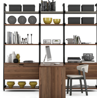
G6 SECTION: 36" + 24" + 36" L/W 103" X L/D 60" X H 92"