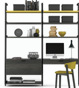
G5 SECTION: 36" + 36" L/W 77 1/4" X L/D 21" X H 92"