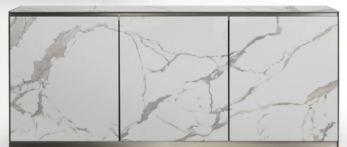
Full doors/ portes allongées